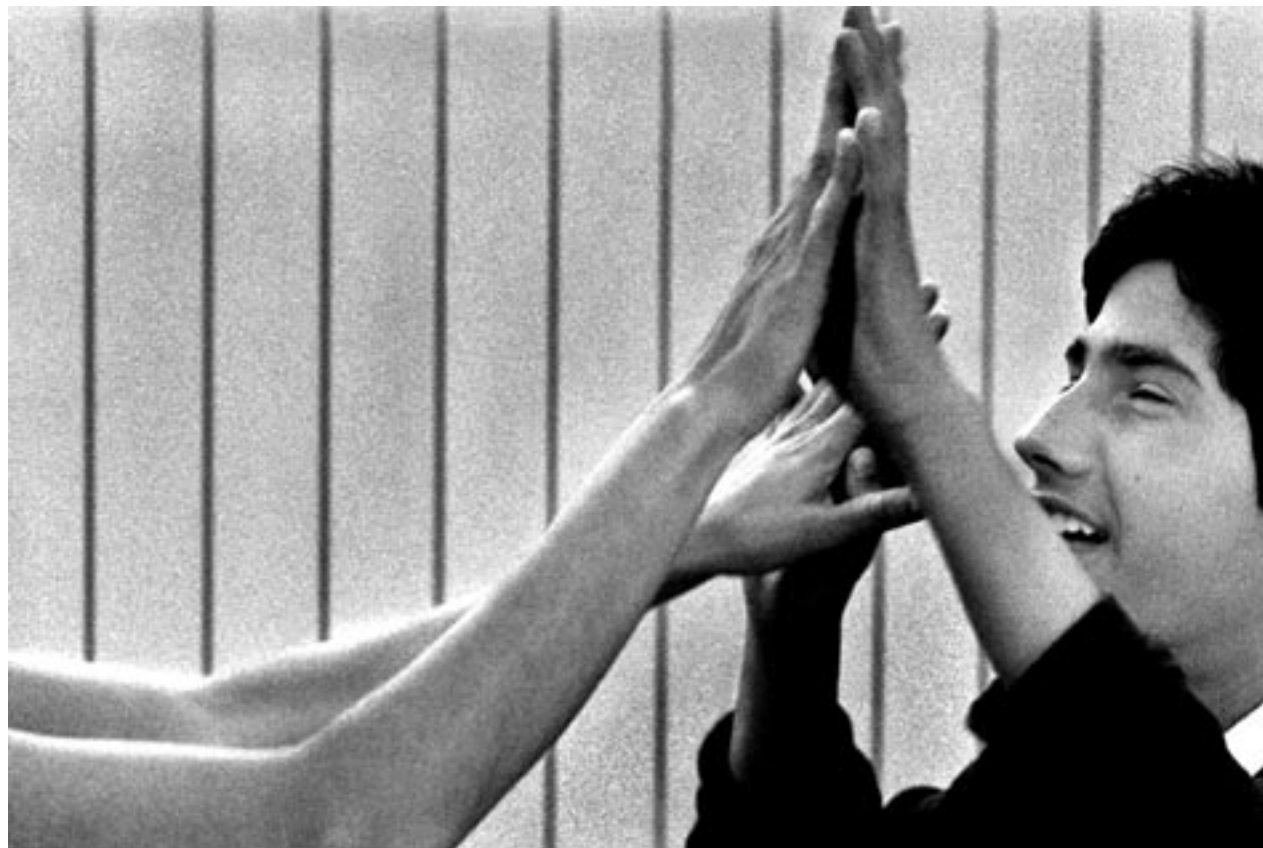
"Tocando, sintiendo", J. Villanueva Sánchez, 2004, Concurso de Fotografía Digital INICO.

Los alumnos con necesidades educativas especiales son sin duda los más excluidos de la educación en muchos países del mundo, razón por la cual se celebró en 1994 la Conferencia Mundial sobre Necesidades Educativas Especiales: Acceso y Calidad, organizada por el Gobierno de España en colaboración con la UNESCO (1994). Esta Conferencia representó una oportunidad internacional para dar continuidad a la labor realizada en Jomtien al situar las necesidades educativas especiales en el marco más amplio del movimiento de Educación para Todos.